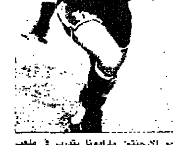
التيبيا يتوجه بجولة داخل المغرب